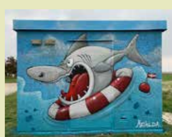
Graffitiverk av Tim Nedrup.

Graffitiverk Reningsverket 20 Christian Palla. Inspektorsgatan 14, Kävlinge