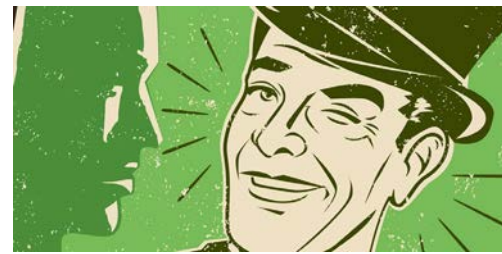
Föreställningen Jag blir nog aldrig bjuden.