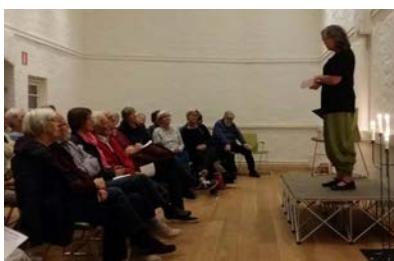
Lögn eller sanning på Lilla kulturhuset Mejerigrändan.